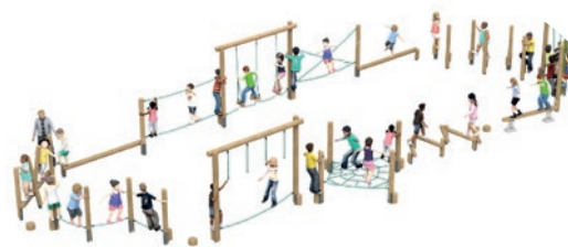
Image d'illustration, parcours d'aventure

La structure de jeux pour le réaménagement du parc des Lilas a été présentée aux enfants du CME. Ils ont validé le choix fait par la commission pour une structure en bois, un parcours d'aventures avec des cordes, toile d'araignée.