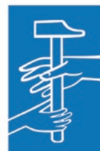
L'Outil en Main