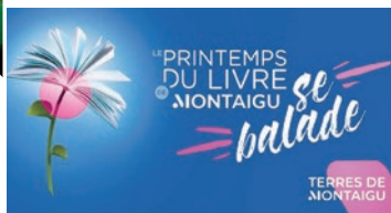
Le Printemps du livre se balade